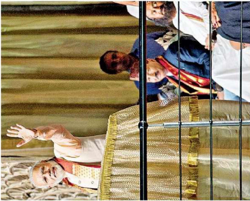
సంస్కృతి ఉత్సవాల్లో మాట్లాడుతున్న ప్రధాని మోదీ. చిత్రంలో శ్రీశ్రీ రవిశంకర్

ఉంది. ఈ భూమిలో ప్రతి సమయానికి ఓ ప్రత్యేక సంగీతం ఉంటుంది. ఉదయ, సాయంత్రాల్లో ప్రత్యేక సంగీతాలు వినిపిస్తాయి. బజారులో సంగీత ప్రపంచాన్ని వెతకడానికి వెళ్తే.. మనుషులను ఊపే సంగీతం అంతటా కనిపిస్తుంది. కానీ మనసులను ఓలలాడించే సంగీతం మాత్రం భారత్ లోనే దొరుకుతుంది. ఈ లోజా జరిగిన సంగీత కార్యక్రమాల ద్వారా ప్రపంచ మనసులను ఓలలాడించింది. ఏదేశాన్నయినా కళల ఆధారంగా చూస్తే.. దాని అంతర్శక్తిని కూడా గుర్తిస్తారు. నేడు ప్రపంచం భారతీయుల కళాకారులను, శతాబ్దాలుగా వారు చేస్తున్న సాధనను గుర్తించింది. ఈ కార్యక్రమ ప్రారంభ సమయంలో ప్రత్యేక కొంత ఇబ్బంది పెట్టేది. ఇది కూడా ఒక ఆర్. ఆఫ్ లివింగ్. సాకర్ వంటకంగా, సరళంగా జీవించుచు దానికి ఇబ్బందులేమీ ఉండవు. కానీ మన బాధ్యులను తలకెత్తుకొని ముందుకెళ్లప్పుడు ఆర్. ఆఫ్ లివింగ్ కావాలి. మన కలలను సాకారం చేసుకోవడానికి ముందుకెళ్లప్పుడు కూడా ఆర్. ఆఫ్ లివింగ్ కావాలి. కచ్చాల్లో కొట్టుపిట్టాడుతున్నప్పుడు ఆర్. ఆఫ్ లివింగ్ కావాలి. మన కోసం కాకుండా వరుల కోసం జీవించేటప్పుడు కూడా ఆర్. ఆఫ్ లివింగ్ కావాలి. అనాం బ్రహ్మసృష్టో మొదలుపెట్టి పనులైతే కుటుంబకంతో యాత్రను పూర్తిచేయడమే ఆర్. ఆఫ్ లివింగ్. మన వాళ్లు ఉపనివ్వాలే నుంచి ఉపగ్రహ యాత్రవరకు వెళ్లారు. ఈ 'జీవించే కళ్ళ'ను మనకు మునుము, రుష్యులు, జ్ఞానులు నేర్పారు. కచ్చాల్లో కొట్టుపిట్టాడు మనుషులవే కళ్ళను ఎప్పుడీ నుంచో నేర్చుకున్నారు. ఇది శతాబ్దాలుగా మన సంస్కృతిలో భాగంగా ఉంది. ఈ కళ్ళలో ఏవైనా లోపాలుంటే వాటికి పూర్తిస్థాయిలో మరమ్మతులు చేయవలసిన అవసరం ఉంది' అన్నారు. ఇంత పెద్ద కార్యక్రమం ద్వారా ప్రపంచం ముందు భారత్ శక్తిని చాటిన రవిశం