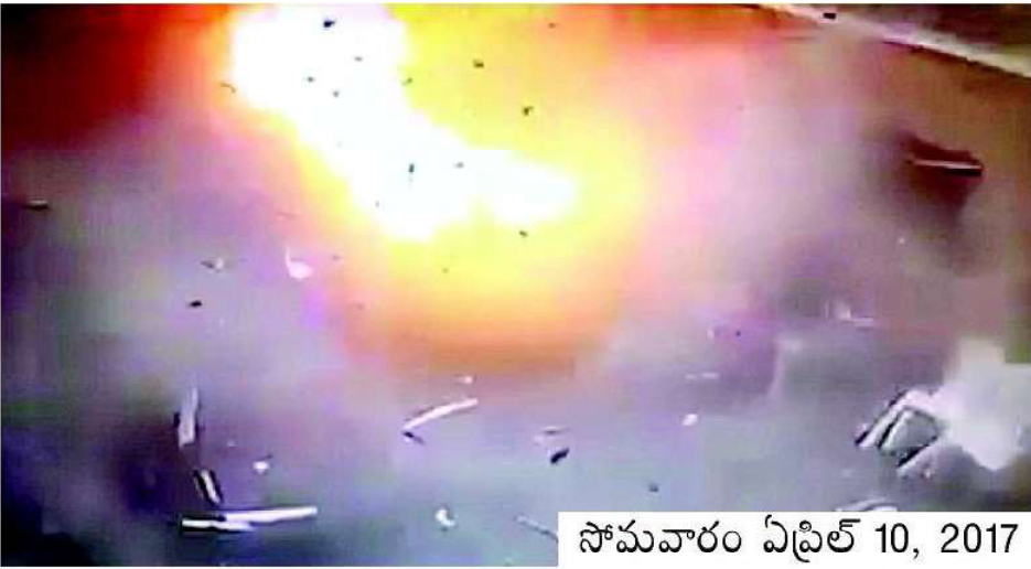
సోమవారం ఏప్రిల్ 10, 2017

ఈజిప్టులోని అలెగ్జాండ్రీయాలో గల చర్చిలో ఆత్మాహుతి దాడి అనంతరం క్షతగాత్రులు, మృతదేహాలను అంబులెన్సులోకి ఎక్కించడానికి సహకరిస్తున్న స్థానికులు విజయవాడ 10-4-2017 సోమవారం ఈనాడు