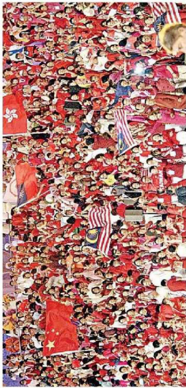
ఉత్సవాల్లో వివిధ దేశాల ప్రతినిధుల ఉత్సాహం

కట్ట మంది ఈ కార్యక్రమాన్ని చూసినట్లు అందుకే వేణం. జన్మద నా కుటుంబం 700 కట్టలు ఎవ్వరూ నా కుటుంబాన్ని అన్వేషించాలనుకుంటే ఇన్ని కట్టలు మంది అన్వేషించాలి. పాకిస్థాన్, నేపాల్, బాల్కన్, సిరియా, లెబనాన్ లాంటి దేశాల నుంచి జన్మదకి ప్రతినిధులు రావడం సంతోషకరం. మన మతా మానవతా విలువలను పెంపొందించాలి. మానవ విలువలను కాపాడటమే అన్ని ధర్మాలు భావన లని చాలాలి. అయిదు అంశాలు ప్రపంచాన్ని కలుపుతాయని విస్తావించి. అందువల్లాలకు చెందినవారు జన్మదకికొన్ని వసవైక కుటుంబక సిద్ధాంతాన్ని గట్టిగా వాటింపబడుతున్నాడు. సానుభూతి, పాకిస్థాన్ జమామ్, జైన్ గురు, అమెరికా నుంచి చచ్చి వెనెం దిలు జన్మదకి వచ్చి కార్యక్రమాన్ని విలయవంతుల చేశారు. సంవేళ్ల వైబడిన కేరళ క్రైస్తవ మతగురువు జన్మదకి రావడం సంతోషకరం. ఇది ప్రపంచంలోని అన్ని ధర్మాల ప్రజల సమానతను చక్క పేర్ల చేయడం ఆకాంక్షలే లేదు. మన మధ్యలోనే ఉన్నాడు. స్వందించే హృదయం నుంచి ఉపేక్షి వస్తాడు. మన అంతర్కర్మాలకి తోచిగానుకుంటే ఆనందం తాండం బంధుల కార్యం. యమున తీరంలో కృష్ణుడు కాళింది నాట్లం చేశాడు. ఆ కాళిందికి మిక్కిలం కలింపి యమునను వదిలితే చేశాడు. జన్మద సాధ్, సువల్ రూపంలో ఆ కాళింది జన్మదకికొంది. యమున శత్రుత్వం ఆత్మలకు తొందరగా చేస్తాం. పర్యావరణం మా ప్రాణం. శరీరాన్ని శత్రుల చేసుకున్నప్పుడే మన ముందుకొస్తున్నారం. ప్రకృతినే కాక మన కంటూ ముందుకొస్తాం. ప్రజలు కుట్రలు, మతాలు, మిగిల ఆధారంగా ముందుకొస్తాం. జన్మదోయలను విగ్రహపరచడమే