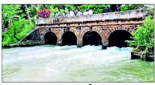
ప్రమాద సంఘన జరిగిన ప్రాంతం